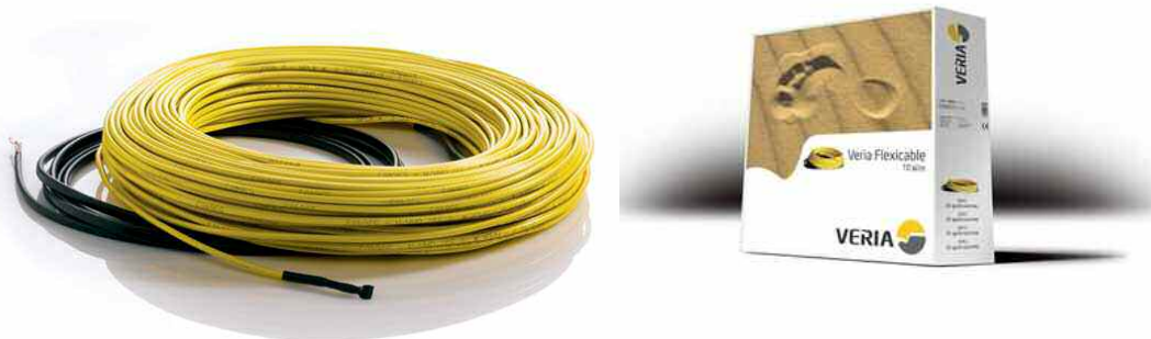
Рис. 1. Нагревательный кабель Veria Flexicable 20

Кабель нагревательный Veria Flexicable 20 (рис. 1) применяется для внутренней или наружной установки и используется во множестве различных областей (таблица 1). Он предназначен для подогрева бетонных полов при устройстве комфортного (системы "Тёплый пол"), или полного отопления помещения, систем аккумуляции тепла с использованием ночного тарифа, а также для защиты от снега и льда открытых площадок, подогрева грунта, защиты трубопроводов от замерзания.